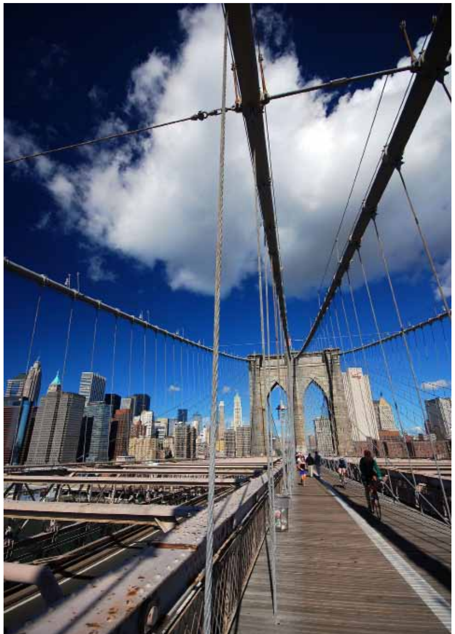
En spadserertur over Brooklyn Bridge kan absolut anbefales.

over East River og de forbipasserende både. Gå en tur i Central Park – den er et besøg værd uanset sæson – og prøv evt. at finde H.C. Andersen-statuen. Er det søndag, ligger der en stor oplevelse og venter i Harlem, hvor de utallige kirker åbner dørene for gospelkoncerter med hjerte og nerve. Eller tag en gratis "havnerundfart"; Staten Island-færgen sejler forbi flere af New Yorks højdepunkter – der er ingen guide, men udsigten taler for sig selv. Skal der bruges nogle dollars, er mulighederne ligeledes mange. Fashionable 5th avenue lokker med sine absolut topklasse mærkevarebutikker, og skal der føjes et par Louis Vuitton-sko eller en Chanel-dragt til samlingen, så er det her, det gøres. I bydelene Tribeca, Greenwich Village og SoHo er udvalget anderledes – mere individuelt og personligt, og her kan gøres mangt et fund i form af kunst, brugskunst, tøj, bøger m.v. i de mange små forretninger og gallerier, hvor det ofte er kunstneren selv eller forretningens indehaver, som sørger for ekspeditionen og en hyggelig snak. South Street Seaport og Pier 17 er også et godt udflugtsmål. Denne kulturelle markedsplads' historiske betydning er på linje med Wall Street, Central Park eller Times Squares, og her tilbydes en vifte af oplevelser for enhver smag; forretninger, restauranter, koncerter, gade-gøgl, båd- og cykeudlejning, markeder... liv og mennesker i skøn forening.