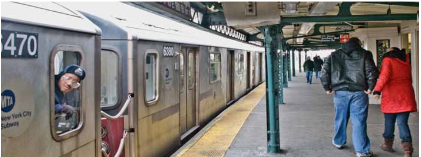
Det er meget let at benytte New Yorks Metro.

over East River og de forbipasserende både. Gå en tur i Central Park – den er et besøg værd uanset sæson – og prøv evt. at finde H.C. Andersen-statuen. Er det søndag, ligger der en stor oplevelse og venter i Harlem, hvor de utallige kirker åbner dørene for gospelkoncerter med hjerte og nerve. Eller tag en gratis "havnerundfart"; Staten Island-færgen sejler forbi flere af New Yorks højdepunkter – der er ingen guide, men udsigten taler for sig selv. Skal der bruges nogle dollars, er mulighederne ligeledes mange. Fashionable 5th avenue lokker med sine absolut topklasse mærkevarebutikker, og skal der føjes et par Louis Vuitton-sko eller en Chanel-dragt til samlingen, så er det her, det gøres. I bydelene Tribeca, Greenwich Village og SoHo er udvalget anderledes – mere individuelt og personligt, og her kan gøres mangt et fund i form af kunst, brugskunst, tøj, bøger m.v. i de mange små forretninger og gallerier, hvor det ofte er kunstneren selv eller forretningens indehaver, som sørger for ekspeditionen og en hyggelig snak. South Street Seaport og Pier 17 er også et godt udflugtsmål. Denne kulturelle markedsplads' historiske betydning er på linje med Wall Street, Central Park eller Times Squares, og her tilbydes en vifte af oplevelser for enhver smag; forretninger, restauranter, koncerter, gade-gøgl, båd- og cykeudlejning, markeder... liv og mennesker i skøn forening.