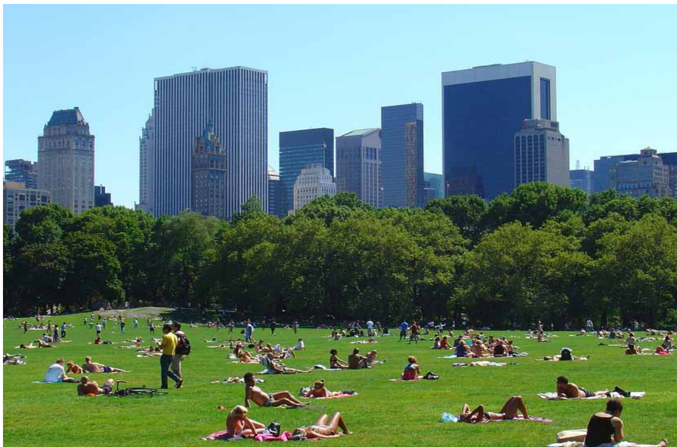
Central Park er New Yorks åndehul i storbyen.

New York er også det perfekte sted bare at læne sig tilbage og nyde de mange indtryk og byens evige puls. Tag en kop kaffe på The River Cafe under Brooklyn Bridge med udsigt