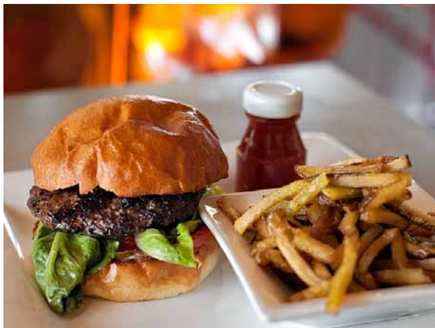
Mange mener at deres tur til USA først er komplet når de har spist en burger

Vi gør opmærksom på, at rejsen er underlagt lokale forhold, hvor både naturkræfter og levevis er anderledes end på vore breddegrader. Det betyder at force majeure-situationer kan opstå med tilhørende forsinkelser og aflysninger, der undtagelsesvis vil medføre ændringer i rejseplanen. Vejrforhold, vejforhold, problemer med køre tøj, gæsternes fysiske formåen samt forsinkede flyafgange kan medføre ændringer i rejsen og at programpunkter kan risikere at udgå. Endelig skal vi gøre opmærksom på, at alle rejser løbende revideres og søges forbedret på baggrund af de tilbagemeldinger, vi modtager efter