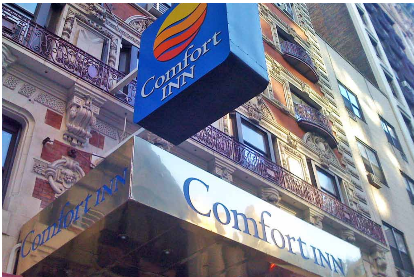
HOTEL COMFORT INN CHELSEA på Manhattan.