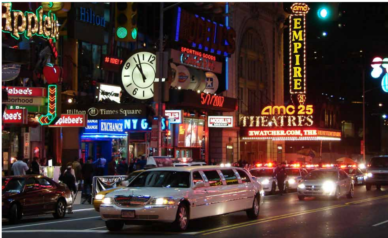
New York er berømt for sit fede natteliv med et utal af muligheder.